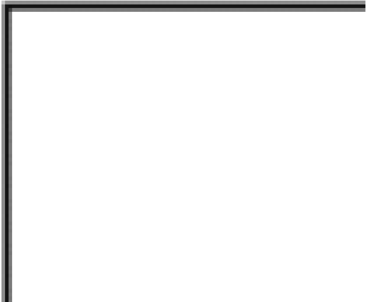
Figura 1. Certificado de Matrícula